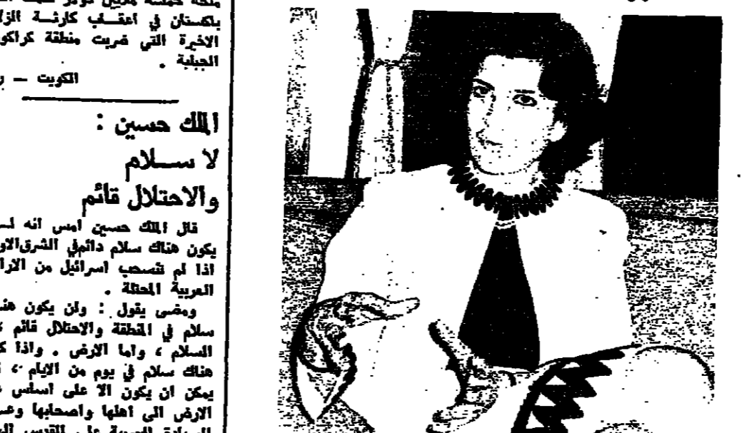
السيدة ميلغرو تحتل إلى «الأنوار»

تحتل تركيا عسكرياً أدى السيدات القبرصيات اليونانيات في الجزيرة، وقد تم إرسالها إلى الجزيرة، وقد كانت على كفيها «شرقي البحر المتوسط» جائزة الدولة، حيث منحتها في وقت سابق من قبل الرئيس الأسبق في قبرص.